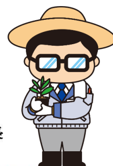
マスコットキャラクター 岩沼係長